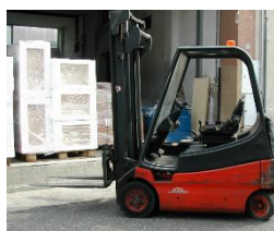
Foto 1, 2, 3, 4, 5: immagini della scena dell'infortunio con i bancali rovesciati durante il prelievo con muletto

Tipo di infortunio: caduta dall'alto di gravi / rovesciamento bancali con pannelli in legno