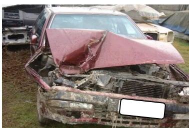
Autovettura coinvolta nell'incidente. Punto d'impatto con il "nasello" dell'attrezzatura.