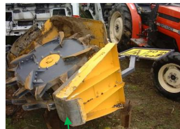
Attrezzatura coricata sul fianco e vista da dietro. Punto di impatto con l'autovettura (nasello).

Tipo di Infortunio: Tamponamento trattore agricolo con conseguente ribaltamento