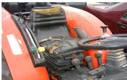
Particolari del sedile di guida sprovvisto di dispositivi di trattenuta del conducente.