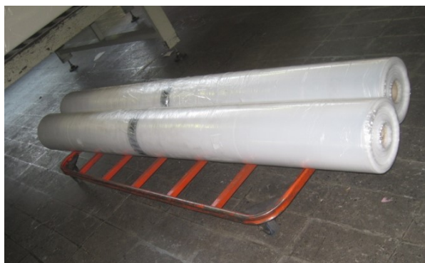
Foto 2 - Carrello Mobile con sopra 2 rotoli

Tipo di infortunio: caduta di grave / colpito al piede a seguito della caduta di un rotolo di poliestere