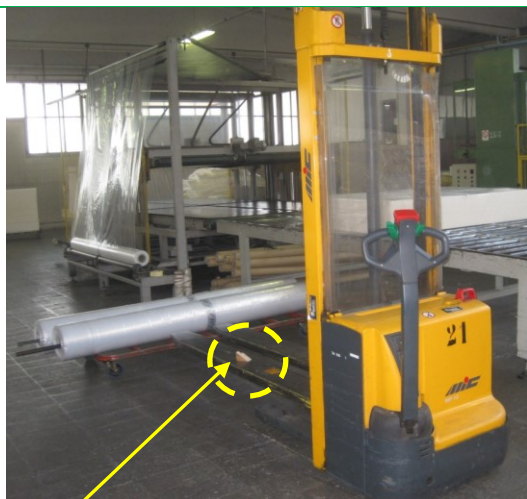
Foto 1 - Transpallet utilizzato (Notare sulla forca il pezzo di legno per tenere i rotoli)

ref. ATS Db inf. n.° 167 / ANNO2011 / Rev.n°06